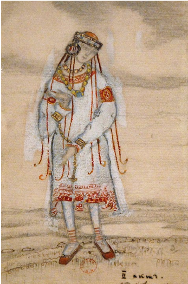
Kostümentwurf für Le sacre du printemps (Ballets russes) von Nicholas Roerich, 1913

geopfert werden soll, um den Gott des Frühlings günstig zu stimmen. Das ist das Thema von Le sacre du printemps .“ Dass ein so archaisches Sujet im feinsinnigen Paris provozieren würde, konnte kaum überraschen. Zumal auch die ungewohnte Inszenierung von Vaslav Nijinsky die Freunde des klassischen Balletts vor den Kopf stieß: Statt in rosa Tutus tanzte die Kompanie in historisierenden Kostümen.