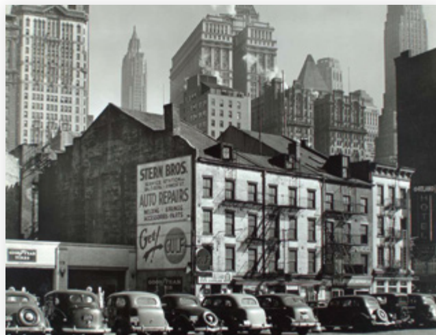
Manhattan in den 1930er-Jahren