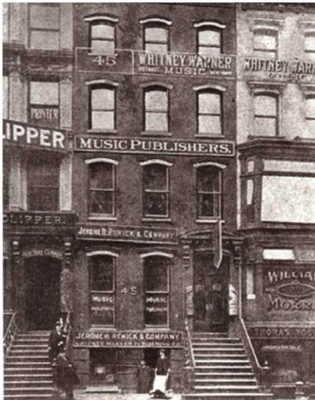
Tin Pan Alley, ca. 1915

Als Dirigent und Pianist zählte er zu den Legenden des 20. Jahrhunderts, als Komponist verband er Stile und Traditionen über alle Grenzen hinweg: Leonard Bernstein . Bereits 1949 hatte er gemeinsam mit dem Choreografen Jerome Robbins über eine Romeo-und-Julia-Geschichte in den Slums der New Yorker East Side nachgedacht. Was dann schließlich im August und September 1957 zunächst in Washington, dann am Broadway unter dem Titel West Side Story Premiere feierte, war eine faszinierende Synthese: ein Werk zwischen Jazz und lateinamerikanischen Tänzen, avantgardistischer Zwölftonmusik und barocker Fugentechnik, gefühlvollen Arien und mitreißenden Rhythmen.