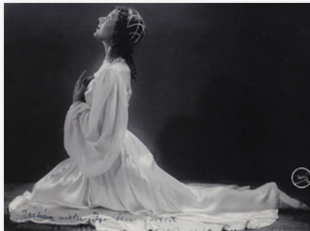
Sergej Prokofjew, Romeo und Julia, Foto der Uraufführung

Wie Bernstein dachte auch Sergej Prokofjew zunächst über Veränderungen der Shakespeare-Vorlage nach, als er 1935 vom Moskauer Bolschoi-Theater den Auftrag erhielt, die Musik für ein Romeo-und-Julia-Ballett zu komponieren. Der 1891 im ukrainischen Sonzowka geborene Komponist war nach seiner Flucht vor der russischen Oktoberrevolution 1918, die ihn zunächst nach Paris, dann in die USA führte, 1932 in die Sowjetunion zurückgekehrt – voller Idealismus und dem Wunsch, „echte