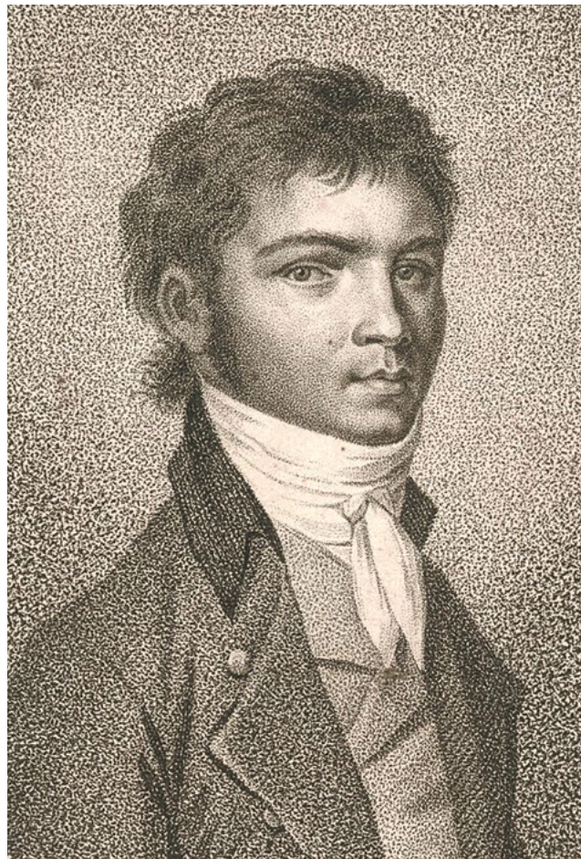
Ludwig van Beethoven 1796 © Stich von Johann Neidl nach einer Zeichnung von Gandolph Ernst Stainhauser von Treuberg

Gräfin seinerzeit. Und glaubt man Czerny, dann ist er auch verliebt in sie. Eine Behauptung, die sich heute nicht mehr überprüfen lässt. Dass Beethoven aber einen erstaunlich vertrauten Umgang mit der Widmungsträgerin der Es-Dur-Sonate und seines ersten Klavierkonzerts pflegte, bestätigt auch einer ihrer Nefen: „Er hatte die Marotte – eine von den vielen – dass er, da er vis-à-vis wohnte, in Schlafrock, Pantoffeln und Zipfelmütze zu ihr ging und ihr Lectionen gab.“