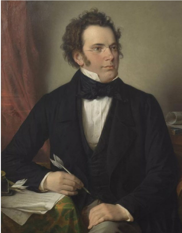
Franz Schubert, Gemälde von Wilhelm August Rieder, nach einem Aquarell von 1825

Als Beethoven am 29. März 1827 in Wien zu Grabe getragen wird, ist Franz Schubert unter den Fackelträgern. Im Freundeskreis erhebt er anschließend das Glas auf denjenigen, „der der Nächste sein wird!“ Er selbst ist es. Nur anderthalb Jahre später findet Schuberts eigene Beisetzung statt – in unmittelbarer Nähe seines großen Idols.