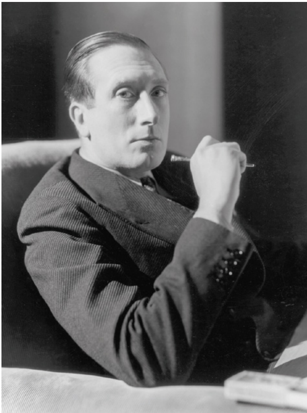
William Walton, 1935

Bejubelt von denen, die in ihm eine Schlüsselfigur für das neue Selbstbewusstsein einer englischen Kunstmusik sahen. Kritisch beäugt aber von jenen, die seine zunehmend neoromantische Tonsprache als Verrat an der musikalischen Avantgarde empfanden.