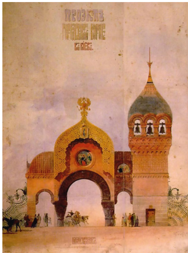
Das Tor zu Kiew, Viktor Hartmann

Ob die Bilder in dieser „Ausstellung“ tatsächlich mit den gezeigten Werken in Stassows Hartmann-Retrospektive übereinstimmen, lässt sich nicht mehr